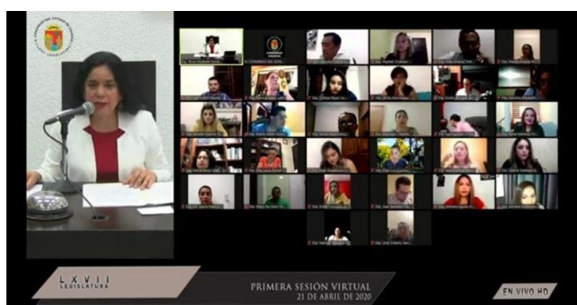
Foto: Primera sesión virtual de Pleno del Congreso de Chiapas, 21 de abril de 2020.

Después, el 21 de abril de 2020, se llevó a cabo la primera sesión plenaria virtual, luego de que se aprobara un decreto que reforma el reglamento interior de dicho congreso local, esto según un comunicado de prensa .